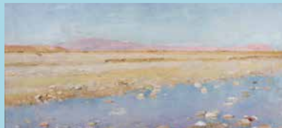
© Paul Leroy, L'océan à Biskra, 1904, huile sur toile, collection musée des beaux-arts de Brest métropole

Musée national de la Marine – Château de Brest Tarif : 5 / 10 € - réservations : 02 98 37 75 51