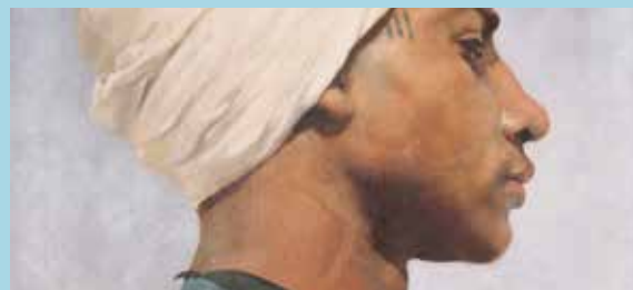
© Paul Leroy, Portrait d'un jeune guide arabe, 1884, huile sur toile, collection musée des beaux-arts de Brest métropole