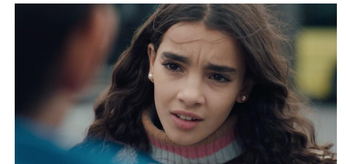
Haut les Cœurs de Adrian Moyses Dullin

Les élèves de Seconde option cinéma du lycée Jules Lesven ont composé ce programme qui, à quelques semaines des élections présidentielles, interroge notre société et invite à débattre à travers 6 films courts engagés.